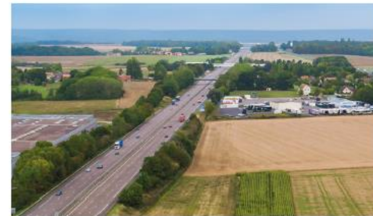
Vue de l'A13 vers Rouen.