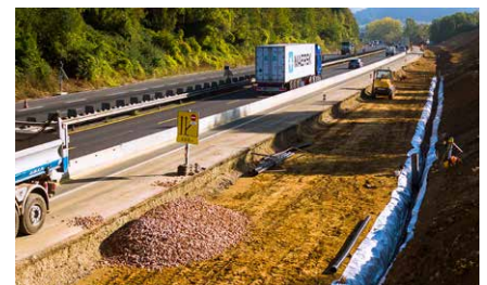
Exemple de balisage sur un chantier d'élargissement

À partir de mi-mars* , les travaux peuvent débuter ; ils sont localisés sur un linéaire de 2,5 km entre la Croix de Hauconcourt (A4/A31) et le diffuseur n°37 d'Argancy. Il s'agit de travaux de nuit permettant l'installation de la signalisation de chantier sur l'A4 (séparateurs de voies et marquage jaune) et de rétablissement d'assainissement, de fibre optique ou de dépose de portique de signalisation, qui, ponctuellement, pourront être bruyants. Des déviations seront mises en place chaque nuit pour maintenir la circulation pendant ces travaux.