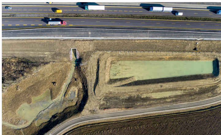
Aménagement écologique du ruisseau d'Argancy et création d'un bassin