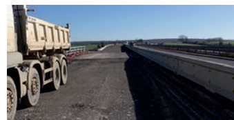
Travaux sur la structure de la chaussée et pose d'un caniveau