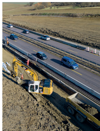
Atelier terrassement en déblai