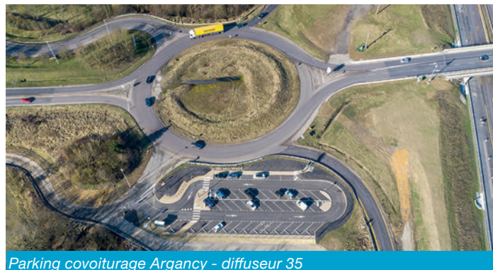
Parking covoiturage Argancy - diffuseur 35