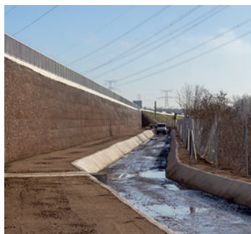
Élargissement de l'A4 et mur de soutènement en contrebas - Zone des Gravières d'Hauconcourt