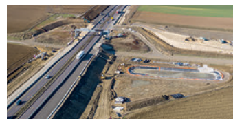
Modification des accès de service RD2 et création d'un bassin